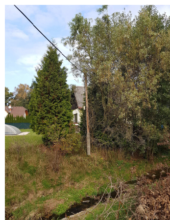
Sloup ČEZ - SI 6 (pravý břeh)