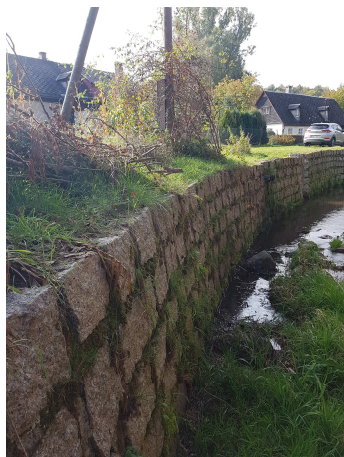
Sloup CETIN - SI7