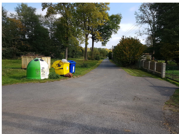
Přístupová komunikace směrem ke stavbě