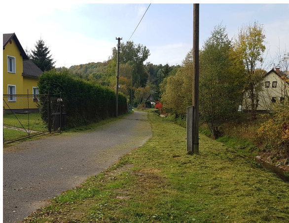
Sloup CETIN – SI 3