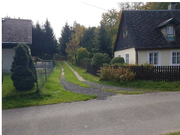
Odbočka mezi č.p. 32 a č.p. 33