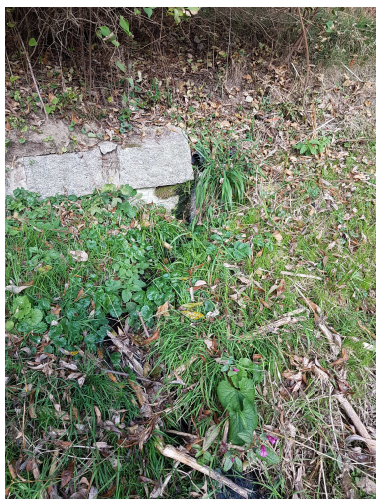
Výusti na pravém břehu