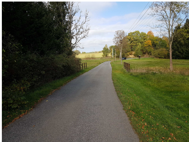
Přístupová komunikace směrem od silnice pod ZÚ