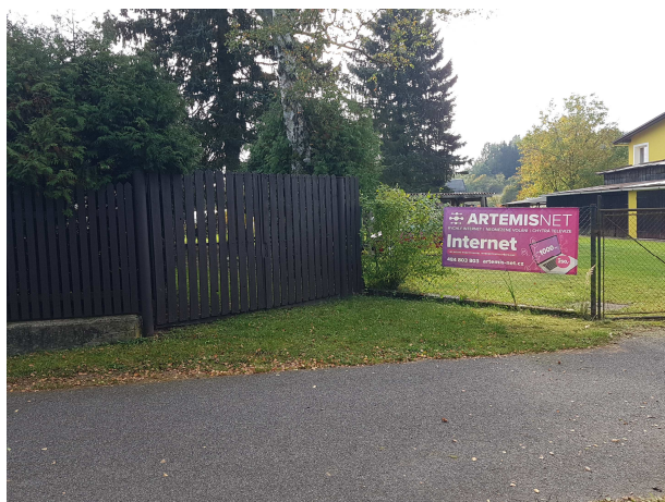
Vstup na pozemek 248