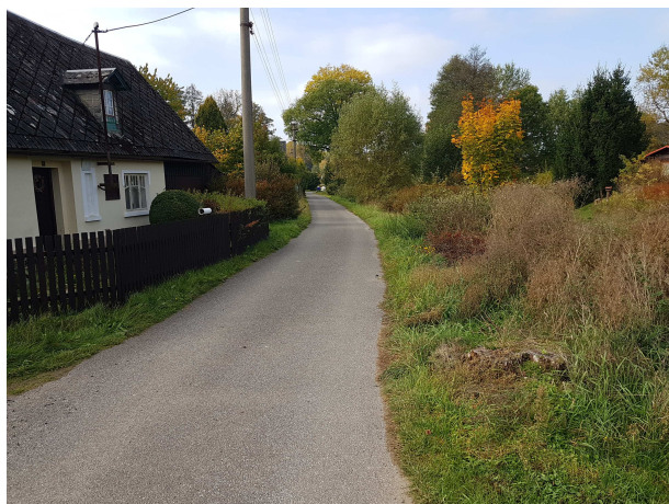
Přístupová komunikace u č.p. 32