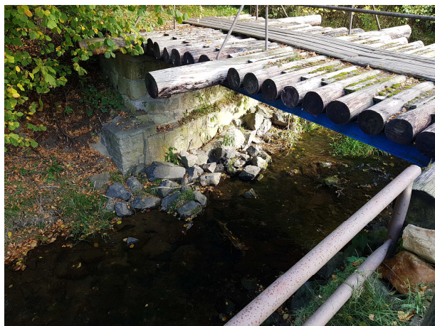
Lávka na konci úpravy