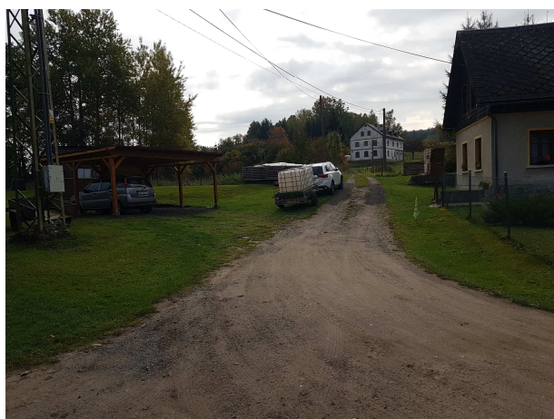
Odbočka u čp 33