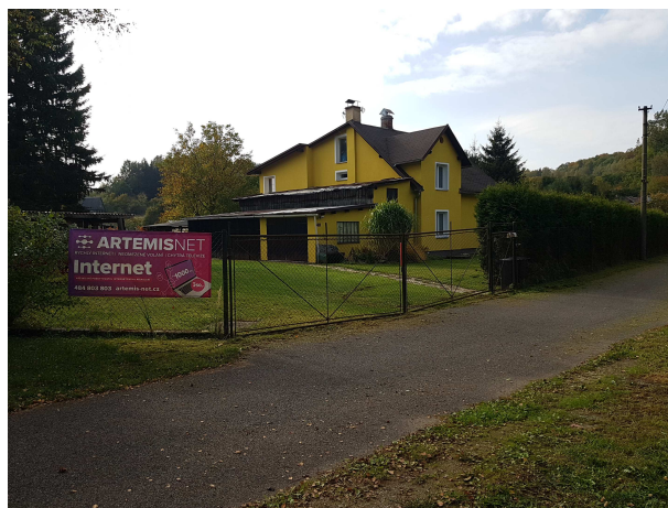
Vstup na pozemek 247