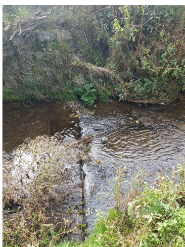
Stávající práh ve dně