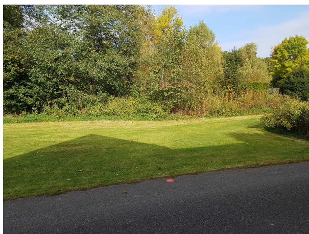
Plocha zařízení staveniště