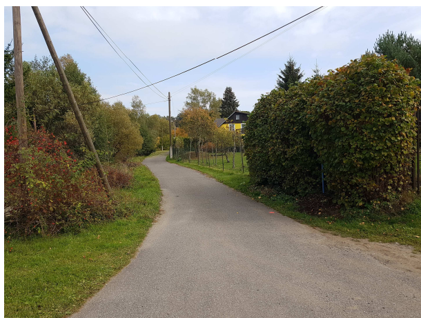
Přístupová komunikace podél pozemku p.č. 246/2