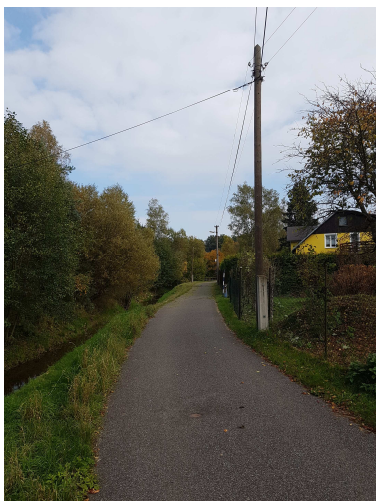
Přístupová komunikace podél pozemku p.č. 246/2