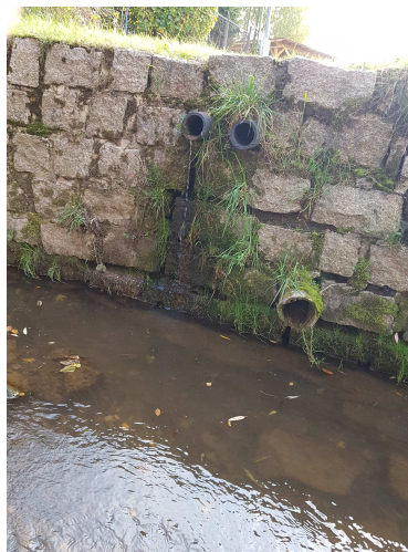
Výusti na levém břehu