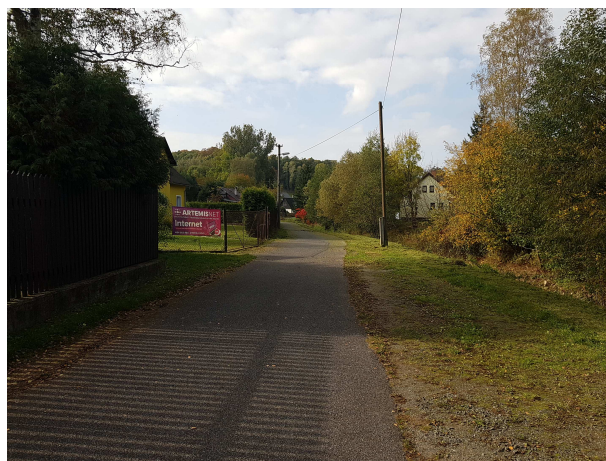
Přístupová komunikace podél poz. p.č. 248