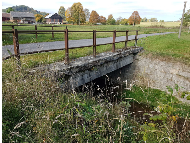
Mostek pod ZÚ