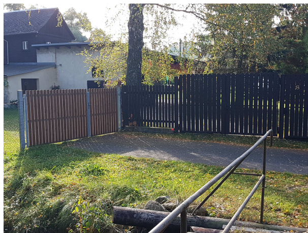
Konec komunikace u lávky vstupy na poz. p.č. 248 a 249/1