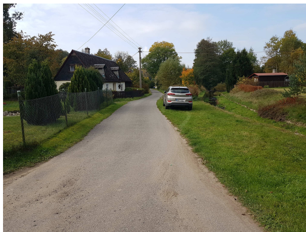
Přístupová komunikace směrem k č.p. 32