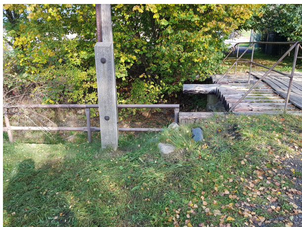
Sloup CETIN – SI 1 a stávající zábradlí