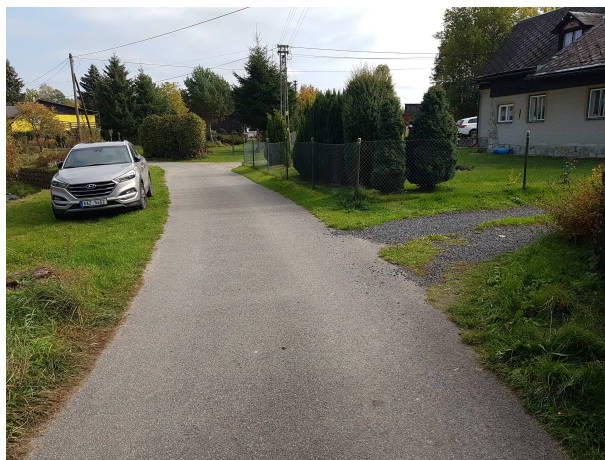
Odbočka mezi č.p. 32 a č.p. 33