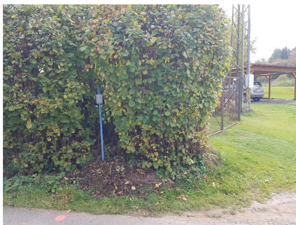
Detail označení shybky vodovodu