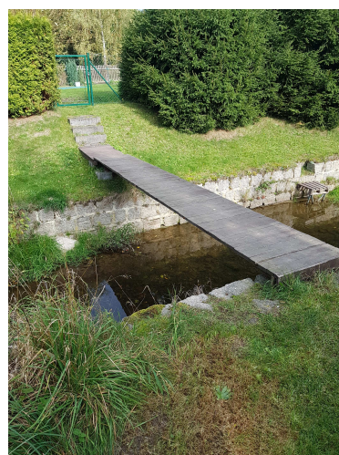
Lávka u poz. p.č. 125/1