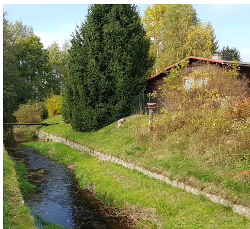
Chata na pozemku 125/1 (pravý břeh)