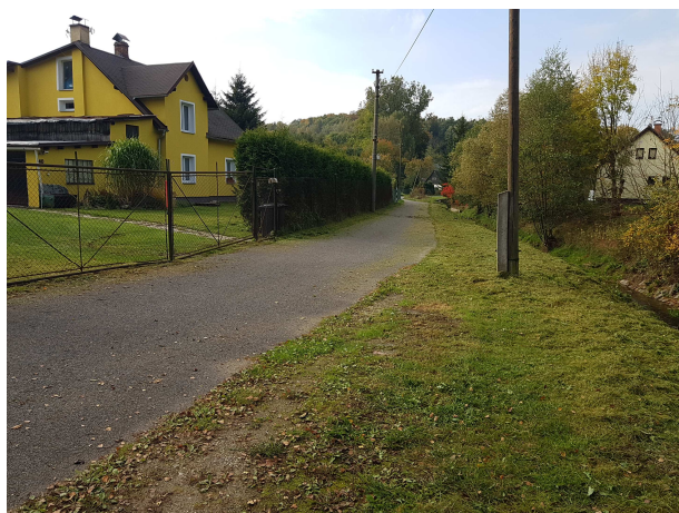
Přístupová komunikace podél pozemku p.č. 247