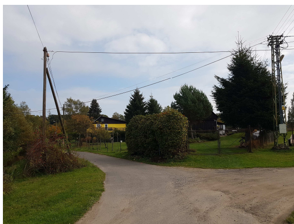
Odbočka u čp 33