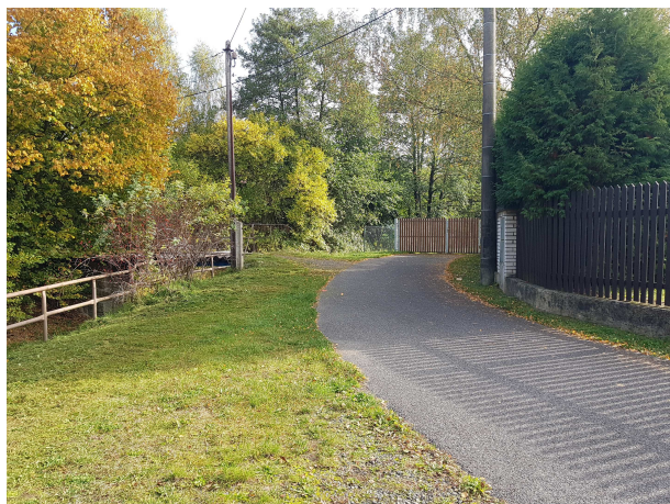
Přístupová komunikace podél poz. p.č. 248